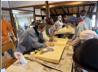
昔取った杵柄、あっという間に丸められました

小春日和の暖かな12月9日、 崎田地区にあるゴンベエ@名無し ルームでオレンジカフェがひ らかれ、餅つきが行われました。 この日の参加者は、いつもより 多い30名ほど。庭に出された臼 でつかれた餅が、次々と丸めら れ出来上がって行きました。