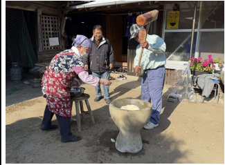
一年ぶりの杵は思いの外重かったです

また社 協の皆 さんが 早朝 より 準備 さ れた ふか しい 芋が これ まで 、つ いて 食べ 過ぎ てし まい 幸せ な一 日で した。