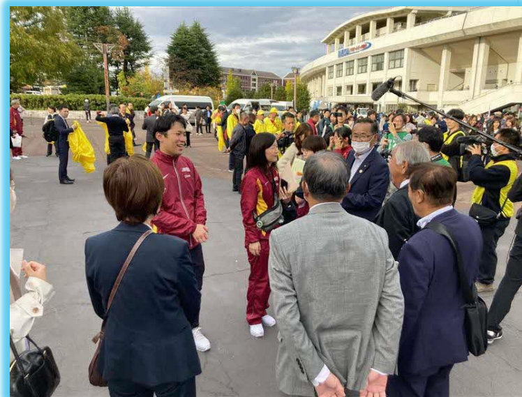
【宮城県】第41回全日本大学女子駅伝大会応援