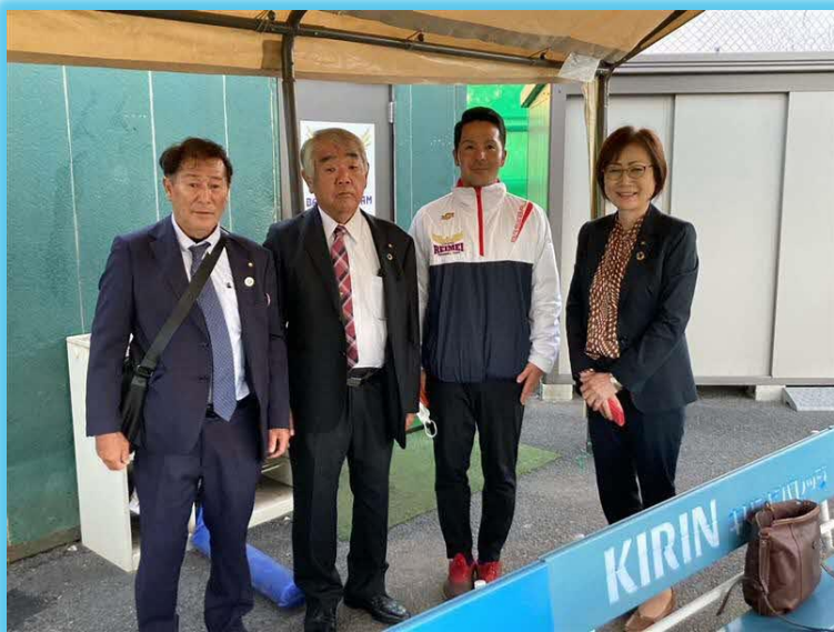
【埼玉県】浦和麗明高校硬式野球部表敬訪問

経済を活性化する効果的な地域振興政策の1つとされる交流人口の増加を図り、スポーツキャンプの誘致促進をはじめとした方策を調査する。