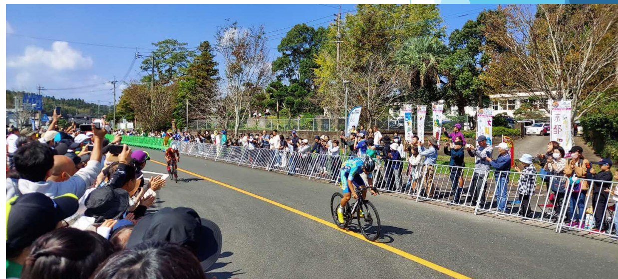
↓ ゴール地点（錦江町田代支所）