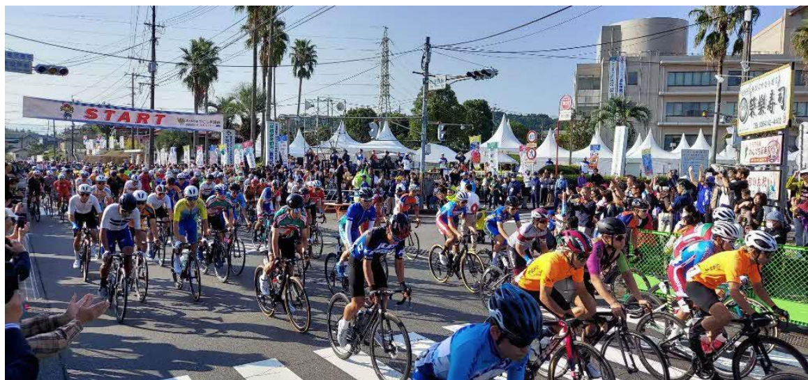
↑ スタート地点（鹿屋市役所前）