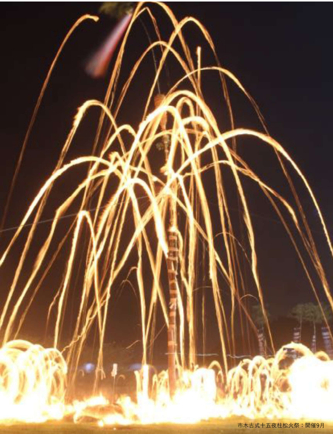
市木古式十五夜柱松火祭：開催9月

串間市の三大祭りとして「都井岬火まつり」「福島港花火大会」「市民秋祭り」があげられます。この3つは全国各地から観光客が訪れます。