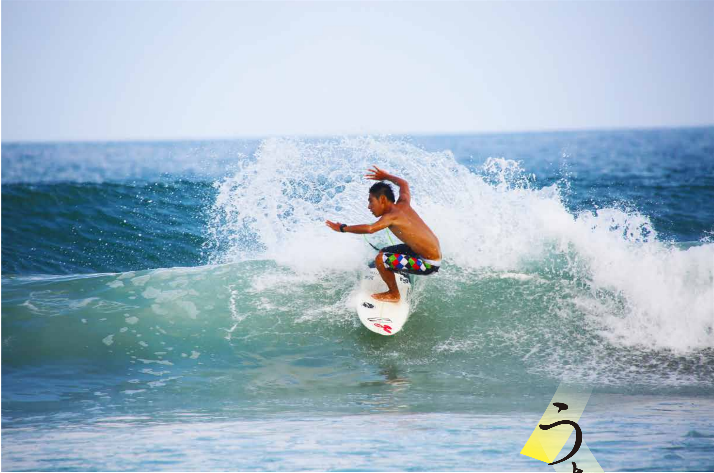
【恋ヶ浦】 県内でも屈指のサーフィンスポットである恋ヶ浦で、波に乗るサーファーの様子。