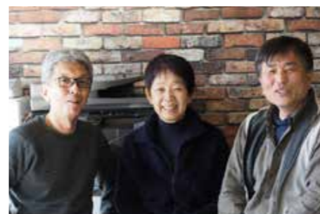
今年度も頑張ります！

さらには、自主企画として、行政と連携を図りながら、櫛間院龍源寺にかかる講演会を実施