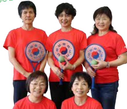
参加者のみなさん