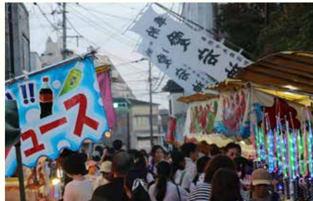
あたご祭りの様子

今年も著名人が多く亡くなっており、周りでも先輩、友人、家族が亡くなっています。運命といっても、「もう少しあなた方達といたい」と思いながら、お盆の迎え火をたいて先祖を迎え、在りし日をしのびながら送り火をたきます。市民の皆さまも、先祖に子どもや孫と一緒に線香を手向け敬って、暑い夏をお過ごしください。合掌。