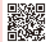
自衛隊募集携帯サイト

問/自衛隊日南地域事務所(日南市飢肥5丁目3-45) ☎0987-32-5066