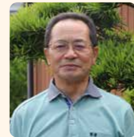
瑞宝単光章(郵政業務功労)

昭和35年から中学校教諭となり、昭和38年に高校教諭へ転身されました。日南農林高校に昭和44年から平成8年まで27年間務められ、教頭や校長を歴任されました。農業教育で先導的な役割を果たされました。