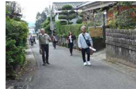
まち元気ウォーキングの様子