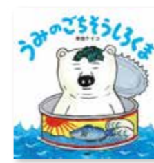
『うみのごちそうしろくま』 柴田 ケイコ/作・絵

図書館では医療情報収集の手助けになればと「医療情報コーナー」を設けてあります。お薬事典や家庭の医学を始め、闘病記や食事療法など、幅広く集めていますので一度ご覧ください。