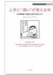
今月のテーマ展示 「医療特集」

図書館では医療情報収集の手助けになればと「医療情報コーナー」を設けてあります。お薬事典や家庭の医学を始め、闘病記や食事療法など、幅広く集めていますので一度ご覧ください。