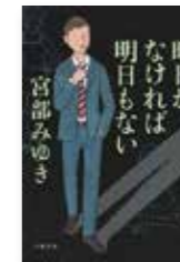
『昨日がなければ明日もない』 宮部 みゆき/著

うみのごちそうが大好きな、くいしんぼうのしろくまは、「うみのごちそうのなかにはいつてみたら、どんなかんじかな？」と想像してみること。アジのフライ、イクラ丼…。どうなるかな？「しろくま」シリーズ第4弾。