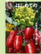
『はじめてのイタリア野菜』 藤目 幸廣

近年、少しずつ野菜売り場に並ぶようになったイタリア野菜ですが、アーティチョークやロマネスコやフェネルなど、気になる野菜がまだまだたくさんあります。種を取り寄せたことがありますが、自分ではうまく育てられず断念。野菜育てのプロにお願いしようと思いこの本を選びました。