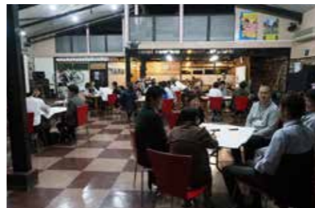
意見交換で盛り上がるみなさん