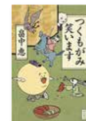
「つくもがみ笑います」

つららは、どんなところに行けるのかな? つららは、どうして長くなるのかな? 冬になると身の回りや自然の中で見かけるつらら。つららの知られざる魅力を、美しい写真とともに伝える。つららをつくる実験も紹介。