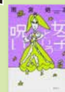
「女子」という呪い 雨宮 処凛 / 著

1975年生まれの著者(女性)が、すべての生きづらい女子たちへエールを送る本です。内容は「オッサン社会にも申す」「女子たちのリアルな日常」「呪いと闘う女たち」「女子という呪いを解く方法」という章立てになっています。なんだかもやもやしている人必読の本です。