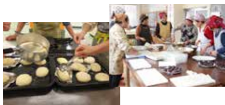
※サークルによっては、ロビーにて作品の販売もいたします。

粘土と布を使った花や人形・布で作る(着物で作る洋服・バッグ・小物)・押し花・クラフトテープで作るバッグ・陶芸・団子・料理・短歌・エッセイ・水彩画・絵画・絵手紙・書道・さわやか学級による押絵など