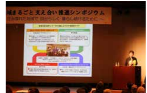
シンポジウムの様子

市民活動交流センターの運営者が新しくなった今年度、私たちはもつと地域に出かけていき、自治会活動など地域の活動にも目を向けていこうとしています。これからの超高齢化社会に向けて、市民活動も暮らししているコミュニティの重要性に目を向け、地域が元気になることを支援することが大切だと思うからです。 1月に参加した「スマートウェルネスステイ講演会」は住民の健康を施策の中心に揚げ、医療費抑制・介護予防で町づくりの先進的な取り組みが可能となる、といったものでした。 2018年3月に前期高齢者と後期高齢者の人口が逆転し両者の差はますます広がる一方である現状で、このような施策が