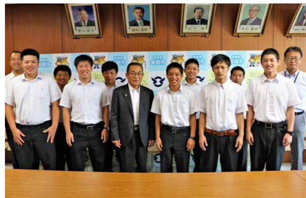
市役所を訪れた福島高校レスリング部

今年の夏は、埼玉県で国内の観測史上最高となる41.1度を観測するなど、全国的に猛暑日が続いています。まだまだ暑い日が続くと思えますので、熱中症に十分注意し、しっかりと水分を補給して無理せず笑顔で過ごしてください。さて、7月の西日本豪雨災害では200人以上の方が亡くなり、農林水産関係の被害額は500億円以上とも言われています。お亡くなりになられた方々のご冥福をお祈り