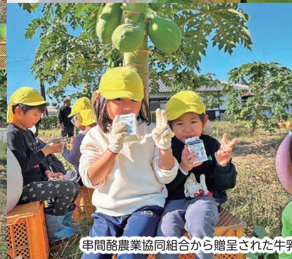
串間酪農業協同組合から贈呈された牛乳

串間市内の若手農家で構成される「串間市SAP会議」は11月20日、市内の子どもたちに農産物の収穫を体験してもらうことで、農業の楽しさや興味を持ってもらい、次世代の担い手確保につなげることを目的として青パパイヤ収穫祭を開催しました。 この日、東町のSAP農園には南さくら幼保連携型認定こども園、さくらさくら幼保連携型認定こども園、かなな保育園の園児ら約60名が集まり、笑顔いっぱい収穫祭となりました。 「串間市SAP会議」は青パパイヤの特産品化を目指し、昨年4月に植え付け。約10アールの面積に植えた約20本のパパイヤは高さ2メートル以上に育ち、大きく青い果実に成長。園児らは、自分の顔より大きく成長した実を両手でしっかりと抱えて収穫する姿が見られました。