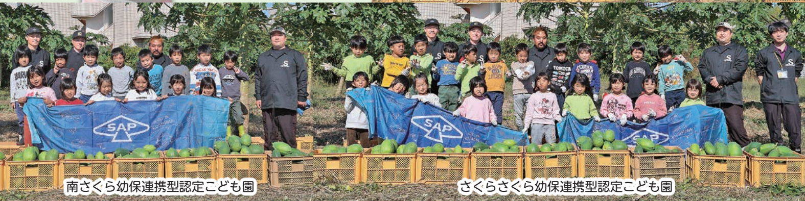
南さくら幼保連携型認定こども園