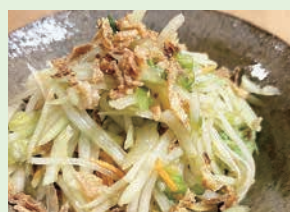
パパイヤ・ヴェールサラダ