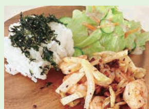
青パパイヤとエビのガーリック炒め