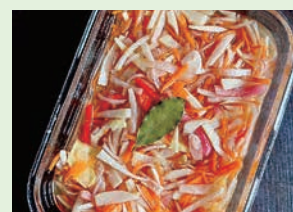
青パパイヤのアチャラ漬け