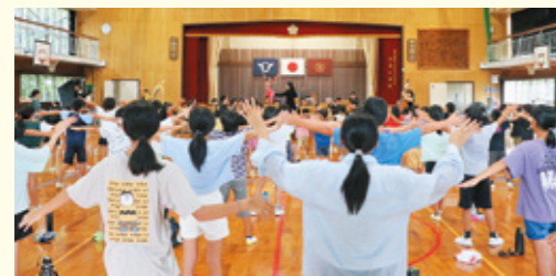
オーケストラの演奏に合わせて体を動かすワークショップもありました

令和4年度「文化芸術による子供育成推進事業(巡回公演事業)」として公益財団法人東京フィルハーモニー交響楽団が大東小学校を訪れました。体育館で全校児童を対象にフルオーケストラによるアンダーソン