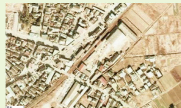
図1) 1974~1978年 串間駅前