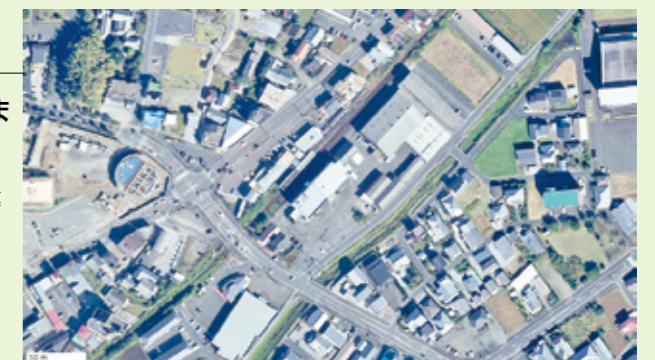
図2) 2020年道の駅くしま 工事中の串間駅前