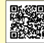
接種率ページの二次元コード

本市における新型コロナウイルスワクチン接種状況は、市公式サイトに掲載しております。