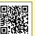
市公式LINE 二次元コード