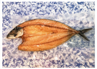
内野水産 アジの干物 600円(税込み)

ほぼ毎回このページで何か食べている私ですが、まだまだお店の商品で味わっていないものもたくさんあります。この機会にまだ食べたことのない商品を食べてみたいと思います。今月は……内野水産さんの干物を食べてみたいと思います！え？ただ食べただけじゃないのかって？いえいえそんなことはありません。れっきとした商品紹介というお仕事です！