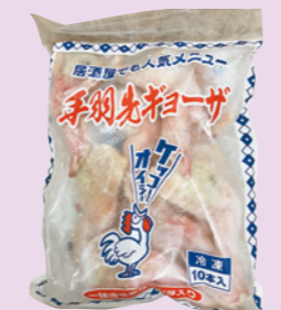
手羽先ギョーザ 982円