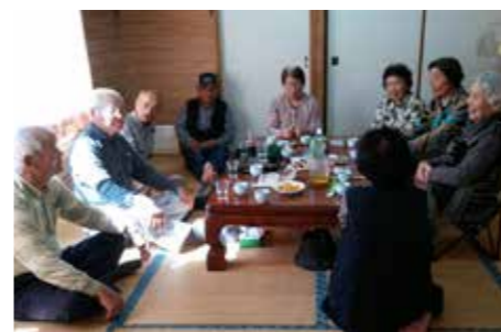
長野地区 いきいきサロン

ほんの少し前の時代では、家のまわりで採れたもの、手作りの食べ物などがありとても豊かな自然の暮らしがありました。長田地区は以前からかんじよの生産地で、公休日を地区で設定