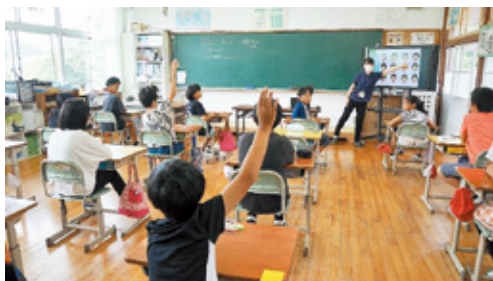
(市木小学校での講話の様子)

「いのちの教育週間（7月の第1週）」に合わせ、市内7小学校の高学年に対し、1人で悩まず相談することの大切さについて、医療介護課の保健師が講話をしました。