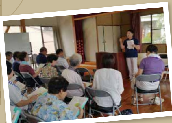
認知症地域支援推進員として日々奮闘中!