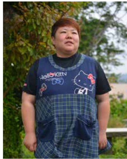
〈6年前に子宮頸がんが発覚〉