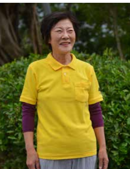
〈2年前に肺がんが発覚〉