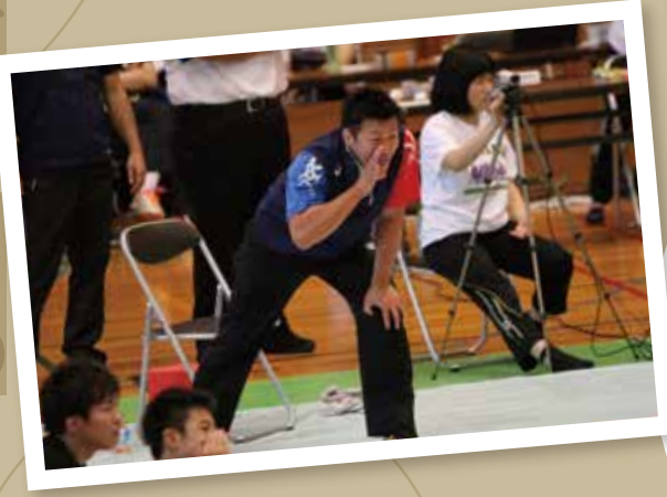
福島高校との対戦を楽しみに新天地で選手の育成に励む