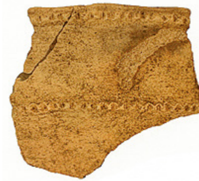
出土した土器片 (上：縄文土器、 下：弥生土器)