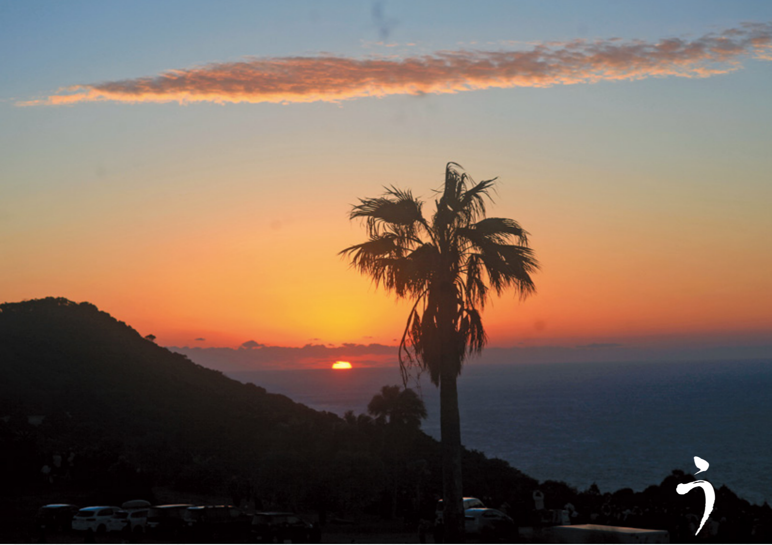
【都井地区・都井岬】「都井岬の初日の出」