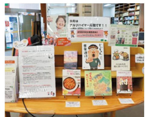
2. 図書館で認知症地域支援推進員が紹介する本