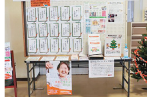
1. 市総合保健福祉センター内での普及啓発