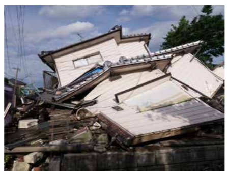
熊本地震被災状況